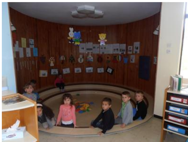
Classe de TPS-PS