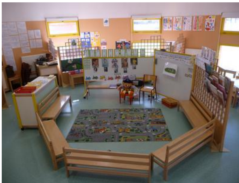
Classe de PS-MS