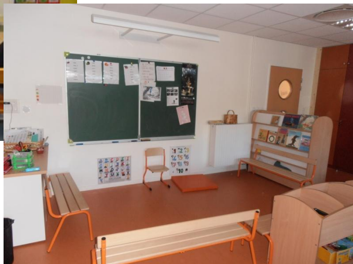
Classe de MS-GS