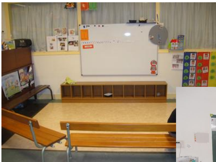
Classe de TPS-PS